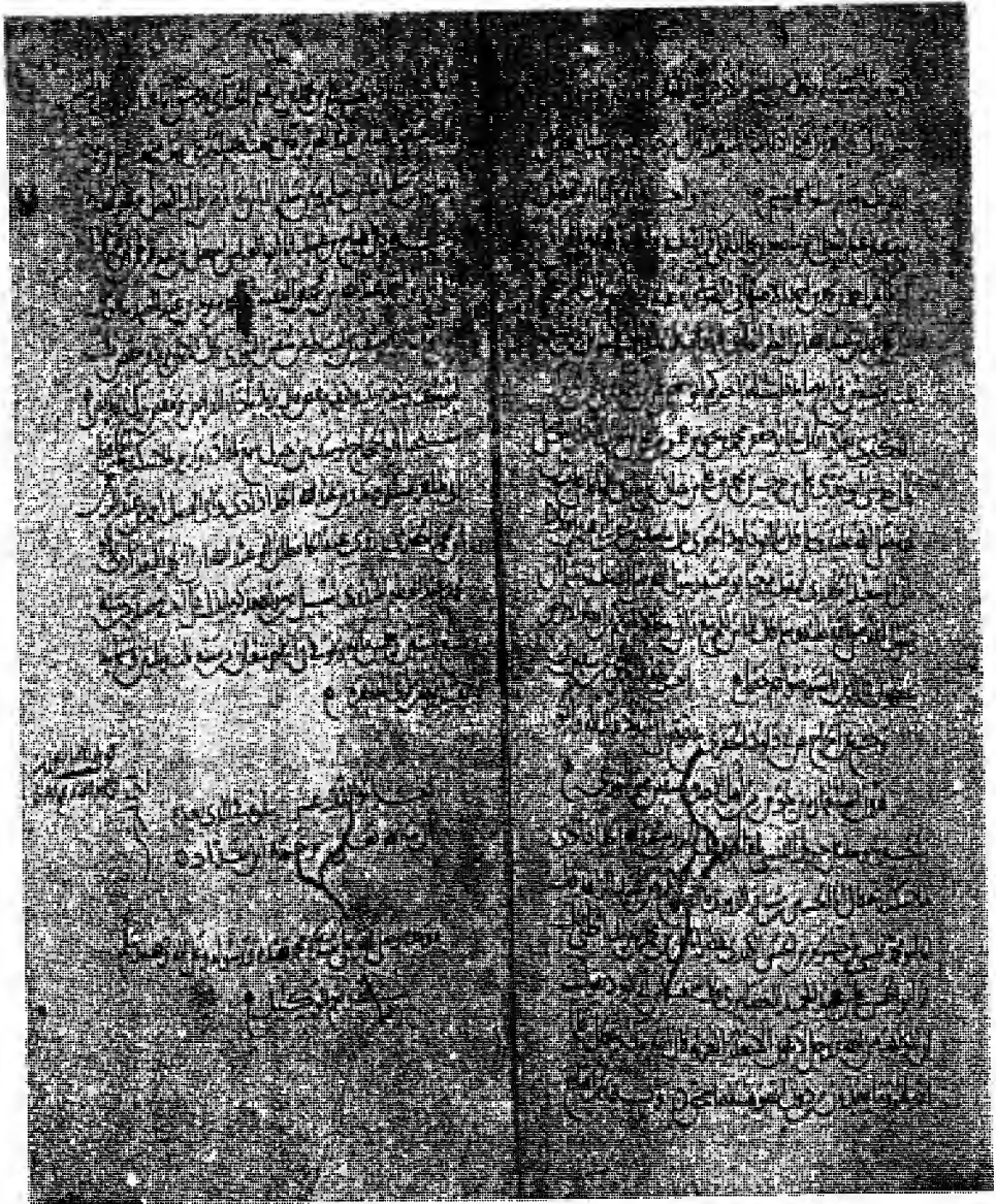
اللوحة الأخيرة من المخطوطة